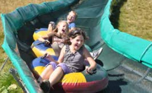
SOMMERTUBING am Hahnenkopf - Kinder ab 5 Jahren!